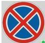
Знак «Стоянка запрещена»